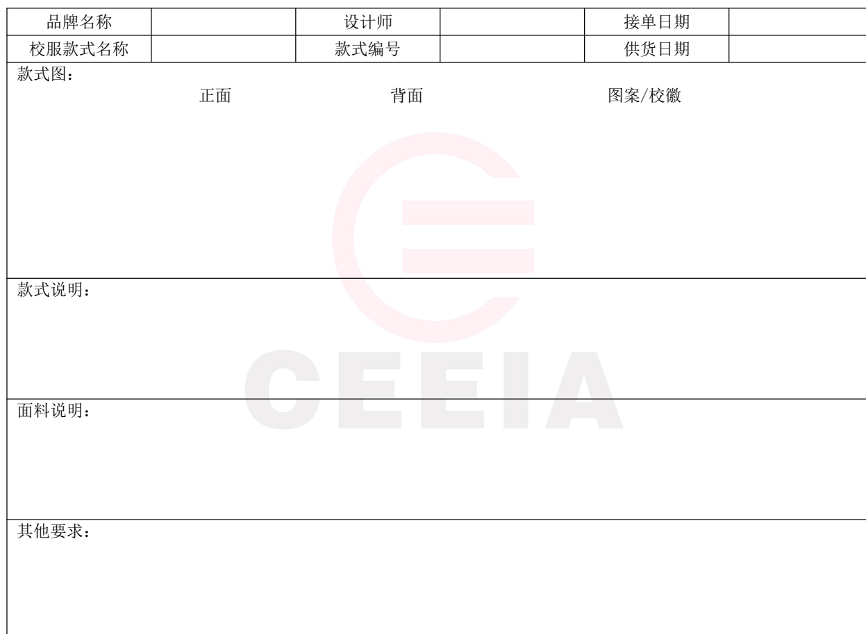
表 A.9 中小学校服征订统计表

学校名称：_____ 学校地址：_____ 学校联系人：_____ 联系电话：_____ 企业名称：_____ 企业地址：_____ 企业联系人：_____ 联系电话：_____